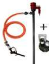
電動ポンプセット