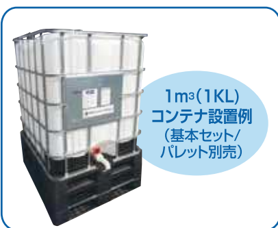
1m³(1KL) コンテナ設置例 (基本セット/ パレット別売)