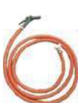
自重落下液取りセット