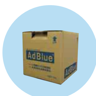
BIB(バッグ・イン・ボックス) 20L、10L